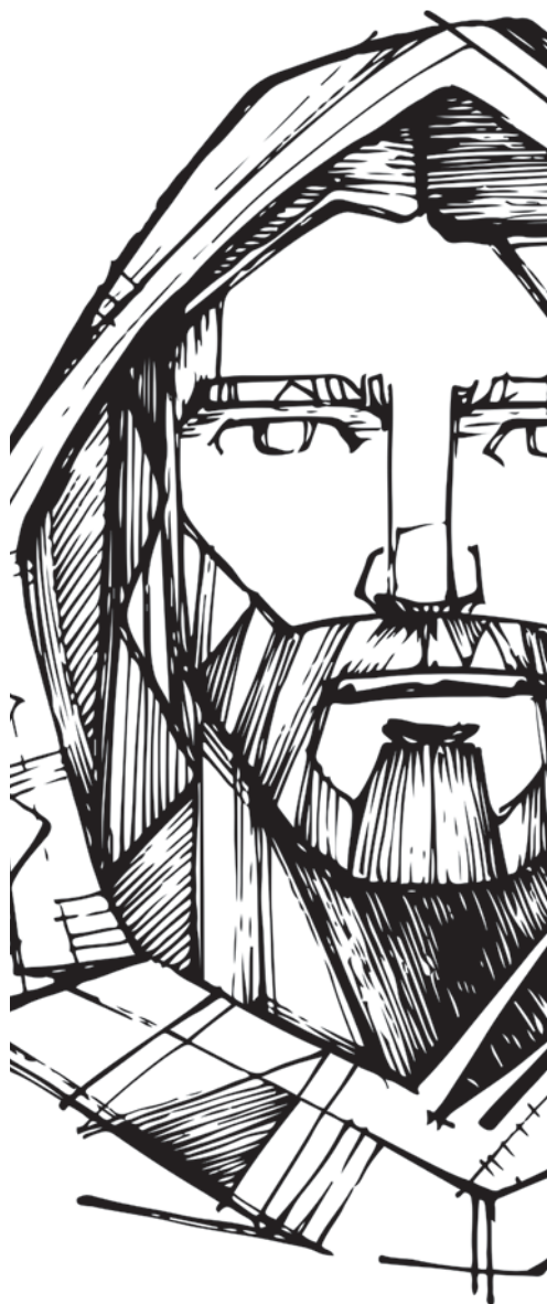
Conception de la maquette : Jérémie Laliberté.